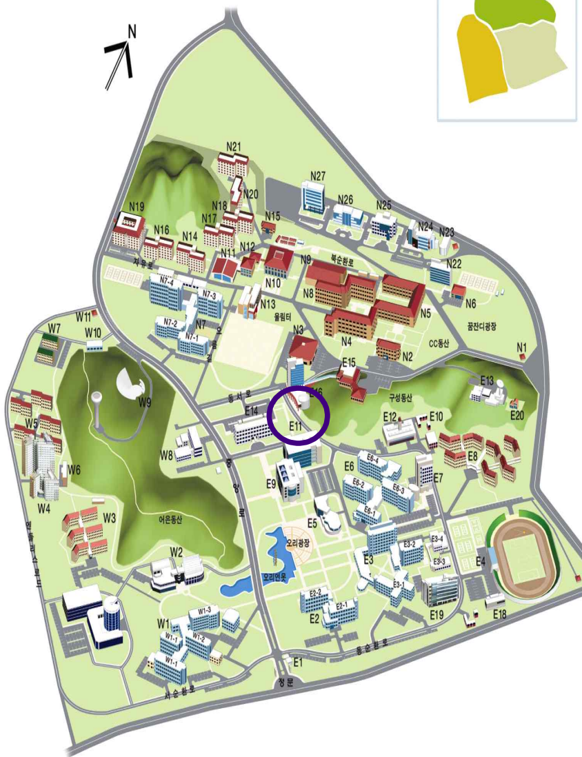
한국과학기술원 건물안내도 (KAIST MAP)