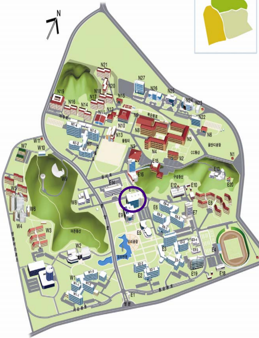
한국과학기술원 건물안내도 (KAIST MAP)